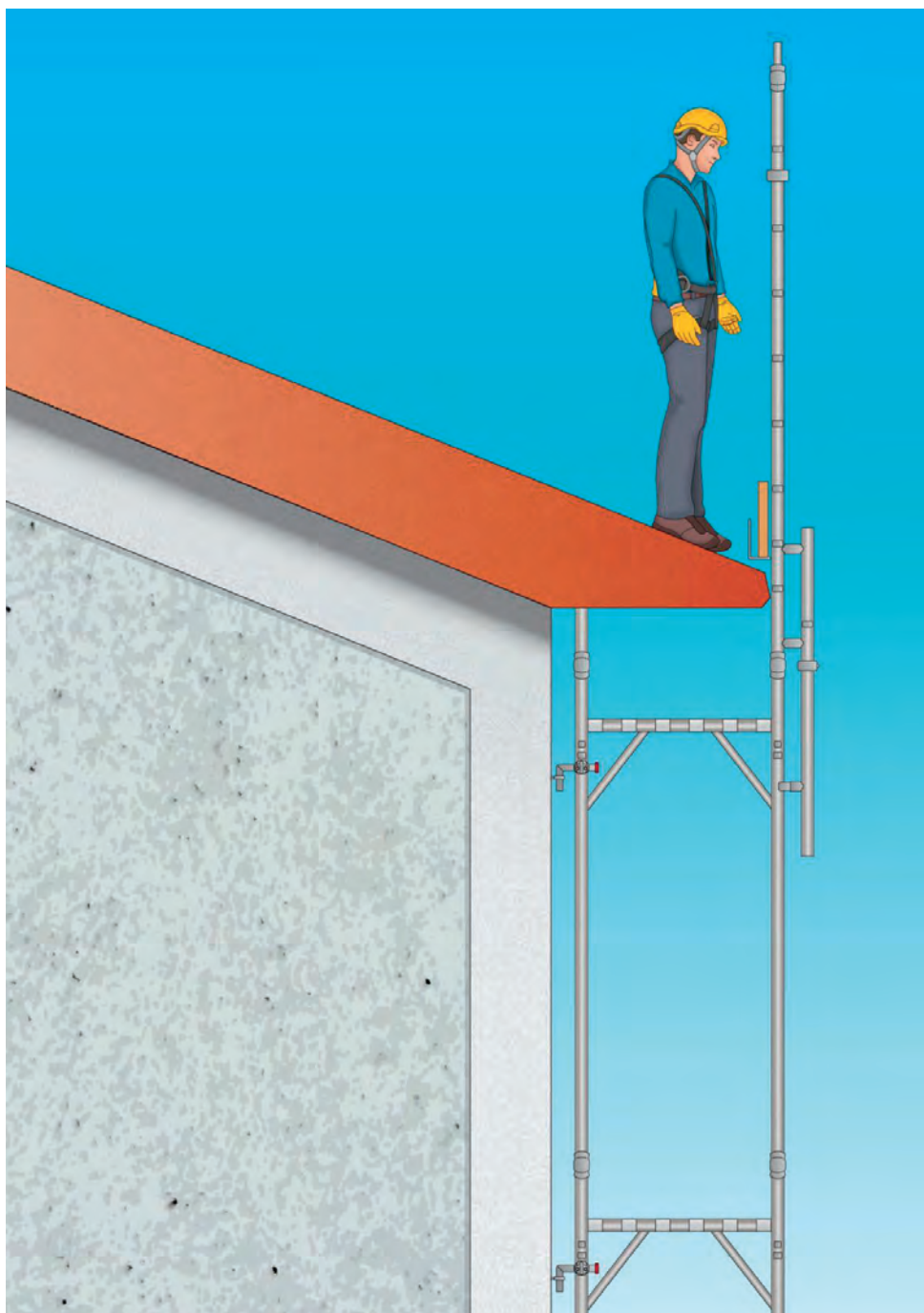
Figura 5 - Esempio di ponteggio utilizzato per la protezione dei bordi